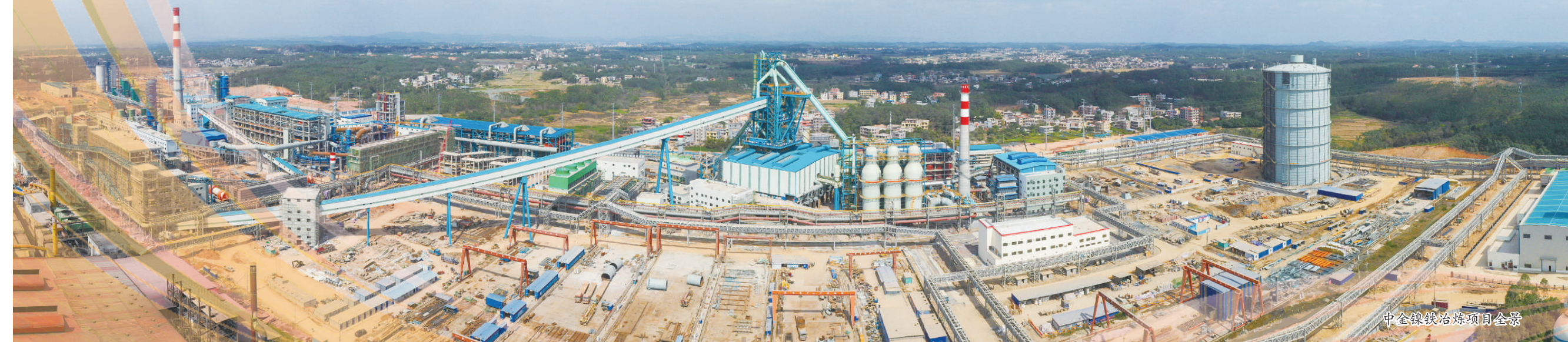
中金镍铁冶炼项目全景