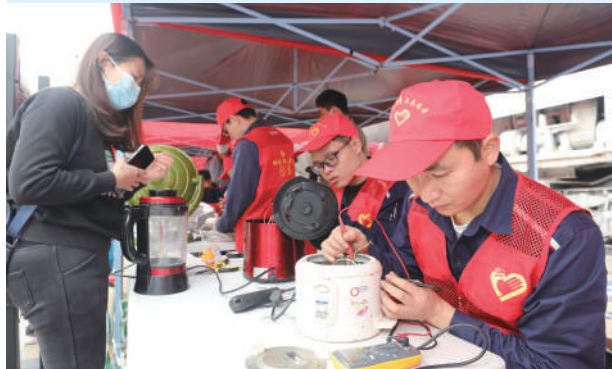
柳钢集团志愿者为市民修理家电