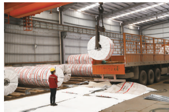
不锈钢卷成品打包外运