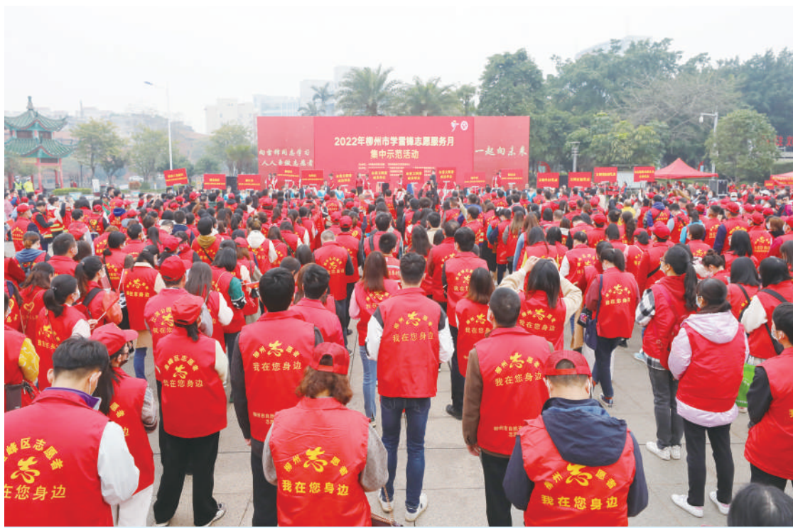
2022年柳州市学雷锋志愿服务月集中示范活动现场