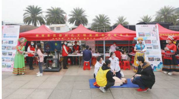
柳钢集团新时代文明实践志愿服务队活动服务点