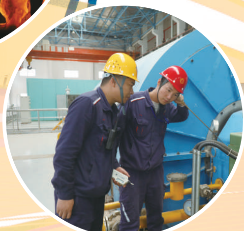
操作人员点检设备