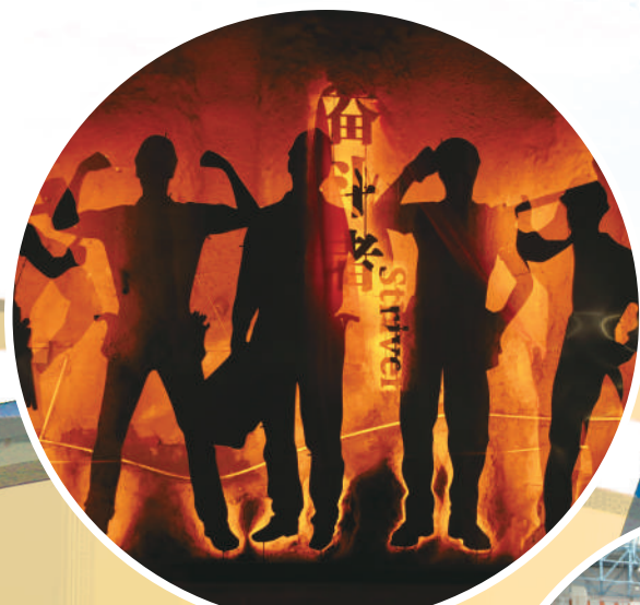
中金奋斗者墙掠影

为巩固深化“效能建设提升年”专项整治成果，推动健全制度、规范流程、精细管理工作，2022年，中金公司立足自身实际，认真开展效能建设工作策划，深刻剖析和着力解决在思想观念、工作方式、政策措施、服务效能等方面存在的问题，制订工作措施，全力助推企业高质量发展。